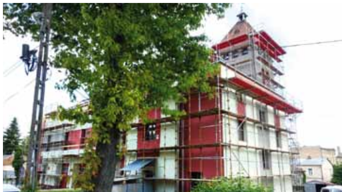
Przebudowa dachu budynku OSP w Dynowie

Wartość ogółem projektu po przetargu: 454 507,51 zł Koszty kwalifikowane: 150 300,00 zł Dofinansowanie (63,63 % kosztów kwalifikowanych): 95 635,00 zł Wkład własny (36,37 % kosztów kwalifikowanych + koszty niekwalifikowane): 358 872,51 zł Koszty poniesione w 2021 r.: 454 507,51 zł