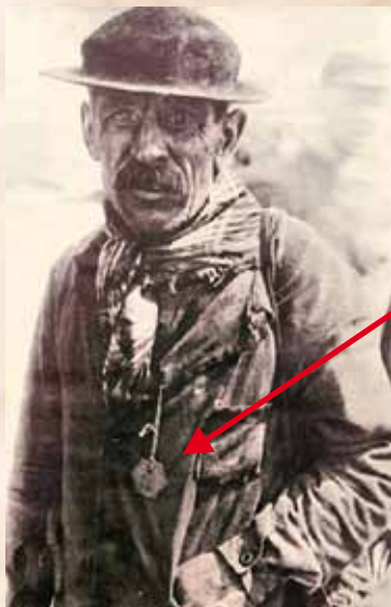
Polski górnik pracujący w kopalniach francuskich (źródło Światowid z 19.08.1933)

Głównym ośrodkiem imigracji polskiej we Francji było zagłębie węglowe w północnej Francji, w departamentach Pas-de-Calais i Nord. W północnej Francji w okresie międzywojennym działało kilkanaście prywatnych kompanii górniczych, zatrudniających górników 29 narodowości, w tym Polaków. Praca we francuskich kopalniach była niebezpieczna z powodu trudno dostępnych złóż, które nie nadawały się do eksploatacji mechanicznej. Często zdarzały się obsunięcia skał, zawały i zalania wodą. Polacy stanowili największy procent zatrudnionych pod ziemią, większość z nich pochodziła ze wsi. Pierwszy zjazd do kopalni był zazwyczaj szokiem. Z czasem przyzwyczajano się, ale nie brakowało też przypadków dezercji. Każdy nowo zatrudniony górnik był fotografowany i otrzymywał numer identyfikacyjny. Mimo