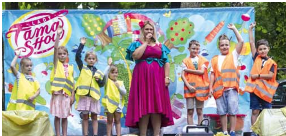
LADY FAMA SHOW