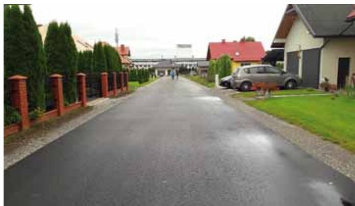
Wyremontowana droga boczna do ulicy Polnej

Zakres rzeczowy robót obejmował: wykonanie nawierzchni asfaltowych na łącznej powierzchni 2894 m 2 , wykonanie podbudów z kruszywa łamanego, wykonanie wzmocnień istniejących gruntów stabilizacją cementową, wykonanie robót ziemnych, remont trzech przepustów pod koroną drogi ul. Zarzeczki w Dynowie wraz z odmuleniem rowów odwadniających na długości 400 mb. Koszt całkowity zadania wyniósł 439,96 tys. złotych. Dofinansowanie ze środków zewnętrznych wyniosło 219,98 tys. złotych. Pozostała kwota w wysokości 219,98 tys. złotych została pokryta z budżetu gminy.