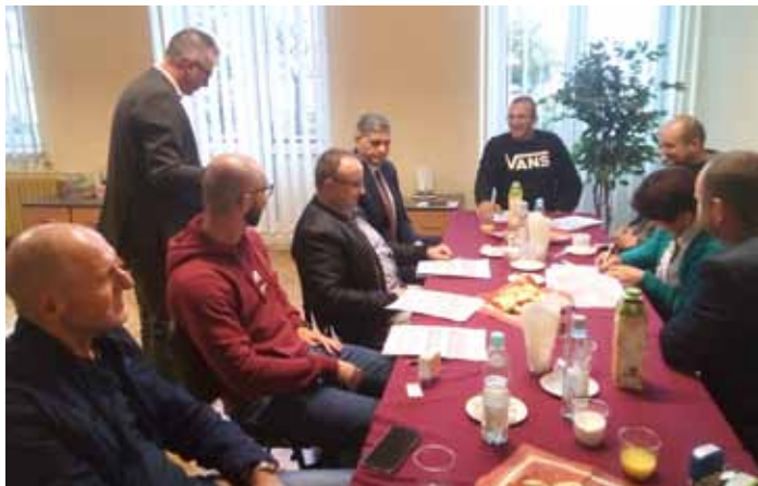
Przekazanie lokalu dla stowarzyszeń przy ul. Rynek 13

Mamy nadzieję, że udostępniony lokal spełnia oczekiwania wnioskodawców oraz wpłynie pozytywnie na współpracę pomiędzy stowarzyszeniami i gminą, czego efektem będą wspólnie realizowane inicjatywy kierowane do mieszkańców Dynowa.