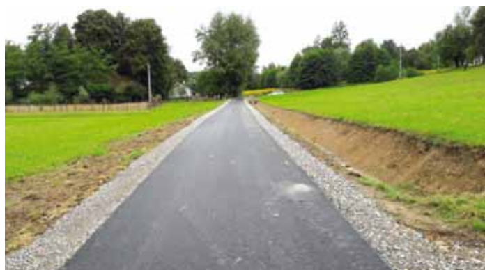
Wyremontowana droga - ulica Zarzeczki w Dynowie