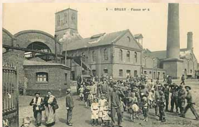
Górnicy opuszczający kopalnię

Opracowano na podstawie materiałów opublikowanych przez Muzeum Emigracji w Gdyni, na podstawie pamiętników, fotografii pochodzących z zasobów Narodowego Archiwum Cyfrowego oraz z internetowej domeny publicznej. Skorzystałem też ze wspomnień moich dziadków, emigrantów francuskich w Bruay, zasłyszanych w dzieciństwie, stąd tekst ten może mieć przekaz nadto subiektywny. Pominąłem natomiast szereg wątków istotnych dla tego tematu, ale niemożliwych do zamieszczenia w przyjętej konwencji syntezy. Niech będzie on dla Czytelnika inspiracją do wykonania przeglądu pamiętek rodzinnych i podzielenia się z redakcją ich wynikami. Może znajdziemy dynowskie ślady tej emigracji?