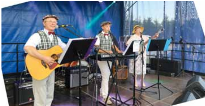
Kapela Tońko, fot. Jan Hadam

8 sierpnia na terenie Ośrodka Turystycznego „Błękitny San” odbyły się 54. Dni Pogórza Dynowskiego, które rozpoczęły się wystawą pojazdów zabytkowych „Weterani Szos” w ramach konkursu „Lokalne pasje – realizujemy je razem”, której pomysłodawcą był Łukasz Kiełbasa.