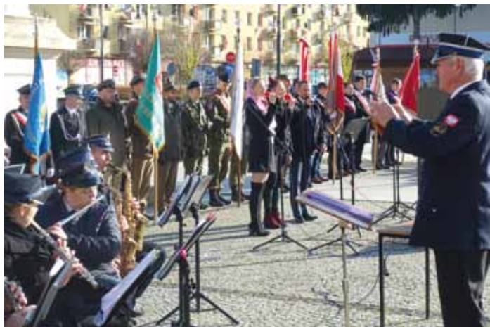
Orkiestra Dęta OSP działająca przy MOK w Dynowie