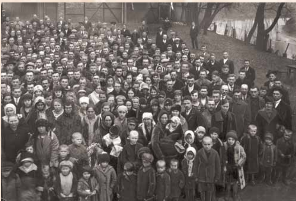
Wyjazd polskich emigrantów z Mysłowic do Toul, 08.11.1929

najlepsze warunki higieniczne. Przed podróżą wszyscy przechodzili kontrolę medyczną. Selekcja, prowadzona przez francuskich lekarzy, pozwalała na wybór najzdrowszych kandydatów. Odrzucono średnio 10-20% chętnych. Po zakwalifikowaniu emigrant przechodził zabiegi sanitarne, ta-