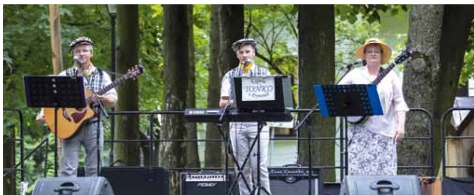
Kapela TONKO z Dynowa, fot. Daniel Gąsecki