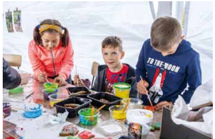
Letnia Kawiarenka Artystyczna