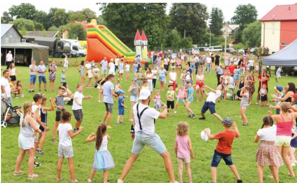
Piknik rodzinny przy u. Bartkówka