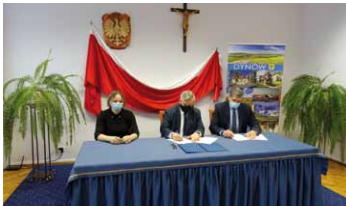
Podpisanie umowy o dofinansowanie projektu w Urzędzie Miejskim w Dynowie

Umowa o wykonanie robót budowlanych została zawarta w dniu 30 czerwca 2021 r.