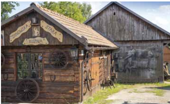
Dynowska Stara Kuźnia z rysunkiem na stodole wykonanym przez Arkadiusza Andrejkowa