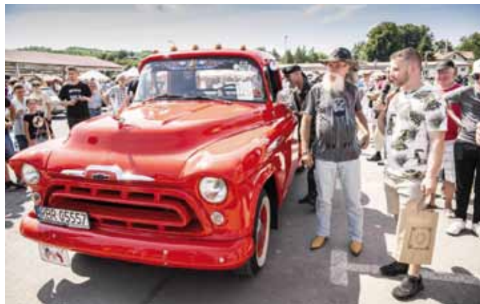
Wystawa pojazdów zabytkowych Weterani Szos