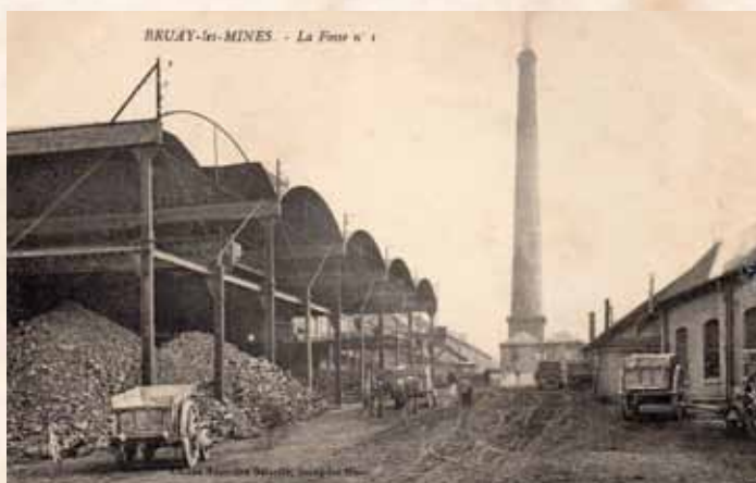
Skład węgla przy szybie wydobywczym nr 1