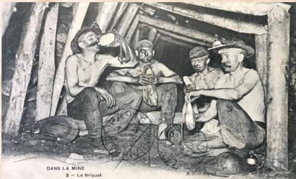
Górnicy w czasie przerwy na posiłek