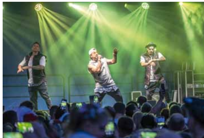
BOYS