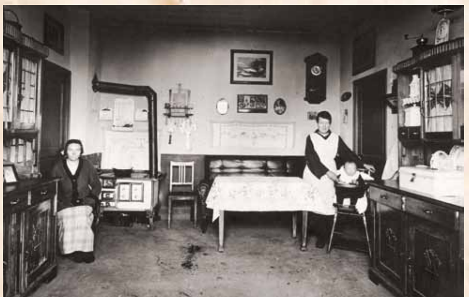
Wnętrze mieszkania emigranta polskiego we Francji, źródło NAC, sygn. 1-Z-634

ni również w Polsce. Domy urządzano zazwyczaj bardzo tradycyjnie, co wiązało się z nostalgią za ojczyzną. Ściany przyozdabiano rodzinnymi fotografiami, wyszywanymi makatkami, obrazami świętych patronów. Przydomowy ogród, średnio o powierzchni 400 m 2 , dla wielu robotników chłopskiego pochodzenia stanowił namiastkę ziemi, którą zostawili w ojczyźnie. Był sposobem na spędzanie wolnego czasu. Uprawiano w nim warzywa, hodowano też świnię i drób. Uzupełniano w ten sposób domową kuchnię i budżet. Kopalniom zależało na stabilizacji zatrudnionych Polaków. Każdy górnik, który przybył do Francji bez rodziny, mógł już po 2-3 miesiącach pracy rozpocząć starania o jej sprowadzenie z kraju. Pracodawcy ponosili 35% kosztów sprowadzenia rodzin. Społeczność polska realizowała tradycyjny model rodziny. Honorami górnika było ją utrzymać, a powinnością żony stać na straży domostwa i edukacji dzieci. Przywiązywano też dużą wagę do podtrzymywania ojczystych tradycji. Oczywiście kobiety mogły podejmować zatrudnienie w kopalniach, ale tylko przy pracach naziemnych, w lampiarni czy sortowni. Pracę podejmowały najczęściej kobiety niezamężne, chociaż i mężatki dorabiały do rodzinnego budżetu, gdy jedna pensja nie wystarczała. Zdarzały się też bóle życia emigracyjnego. Rozluźnienie więzi powodowało rozbitcie rodzin, duży odsetek nieślubnych dzieci, ucieczki żon z sublokatorami.