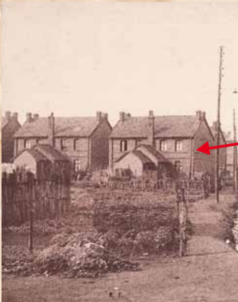
Bruay, domy górnicze wraz z widocznymi ogródkami