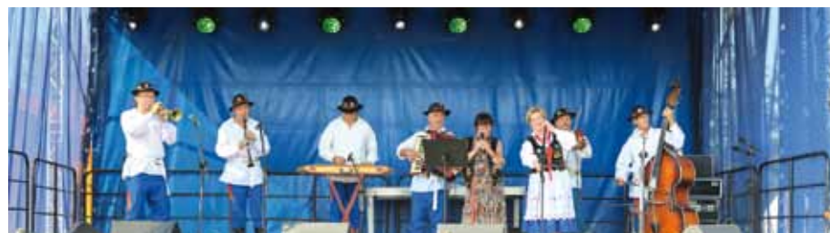
Kapela Dynowianie