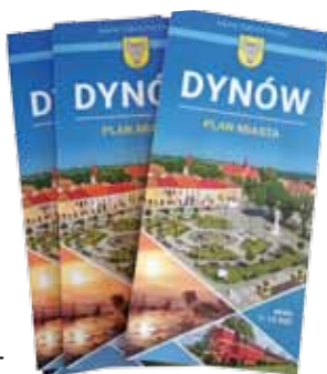
Mapa Dynowa, fot. z archiwum Urzędu Miejskiego w Dynowie