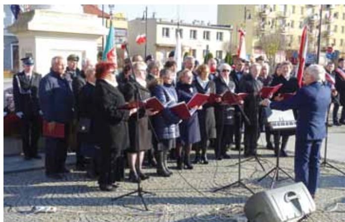
Chór AKORD