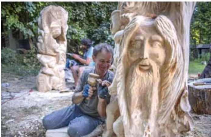
Plener Rzeźbiarski