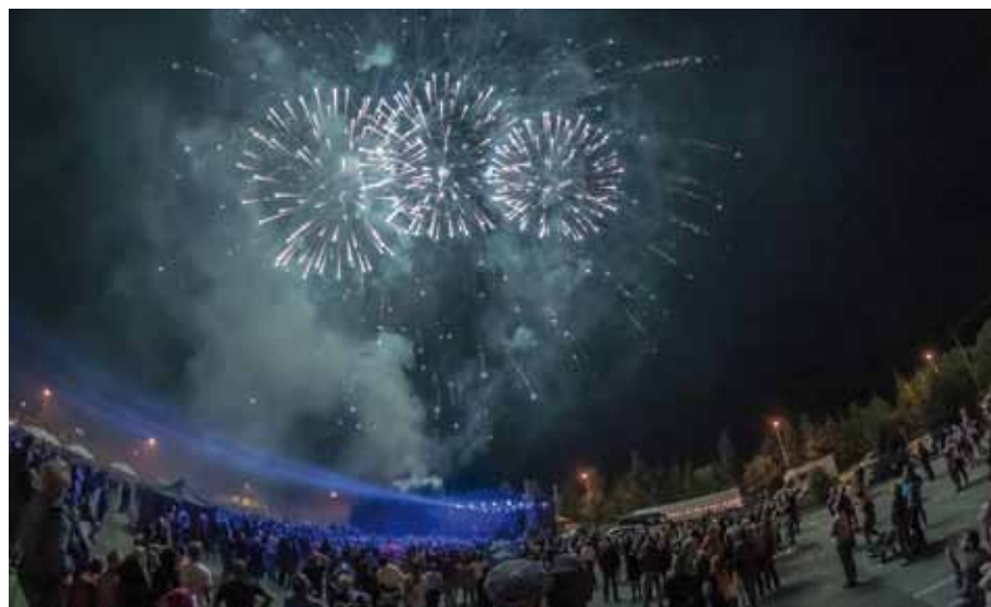
Pokaz sztucznych ogni