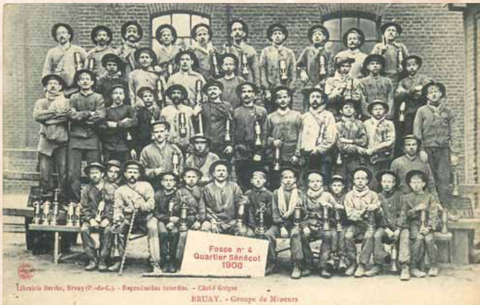
Wygląd i wyposażenie górników. Mimo iż zdjęcie jest wcześniejsze, ubiór i wyposażenie nie zmieniło się do lat trzydziestych.

Marki - znaczki kontrolne, które służyły do ewidencji osób pracujących pod ziemią, miały postać okrągłych lub wielokątnych blaszek z otworem. Markę górnik zabierał na dół, miał ją przy sobie w czasie pracy, a wyjeżdżając na powierzchnię oddawał wieszając na specjalnej tablicy przy odpowiadającym numerze lub wręczał urzędnikom. Brakująca marka wskazywała, że górnik nie wyjechał na powierzchnię. W przypadku pożaru lub innego wypadku, po numerze na odnalezionej marce identyfikowano zwłoki górnika.