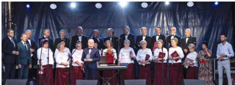
Chór AKORD