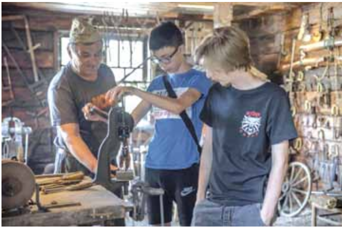
Warsztaty w Dynowskiej Starej Kuźni