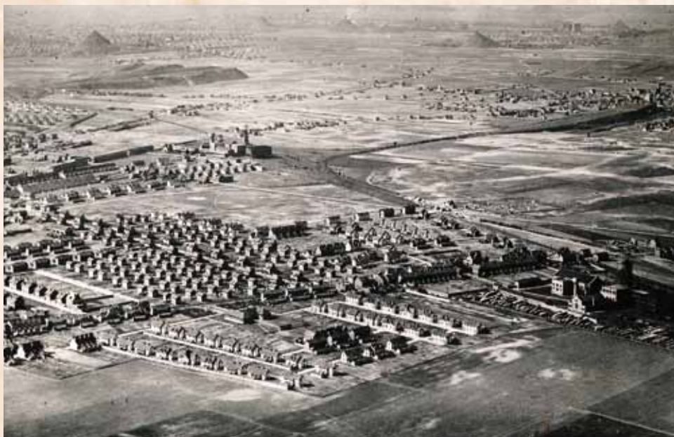
Carboland – kraina węgla i świat wiecznej pracy

Zakwalifikowanych odsyłało do stacji zbornych w Warszawie, Poznaniu, Mysłowicach i Wejherowie. Na stacjach tych dopełniano formalności administracyjnych, związanych z wyjazdem. Panował tam ścisk i nie