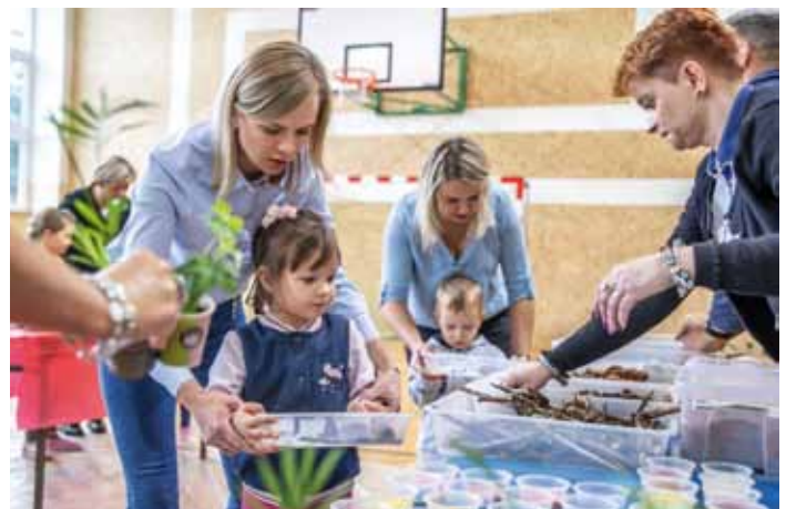
Warsztaty Las w słoiku, fot. Daniel Gąsecki