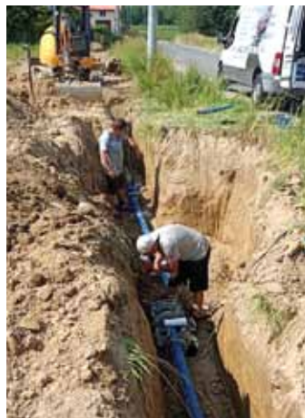
Budowa sieci wodociągowej

Obecnie mieszkańcy mają możliwość podłączenia się do wybudowanej sieci. Przyłącza są wykonywane przez Zakład Gospodarki Komunalnej w Dynowie, natomiast ich realizacja jest finansowana przez mieszkańców, którzy wykazują chęć podłączenia do sieci.