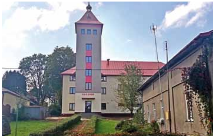
Przebudowany dach budynku OSP w Dynowie, fot. z archiwum Urzędu Miejskiego w Dynowie