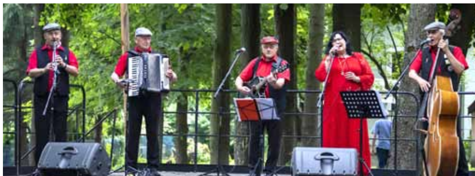
Kapela Ta Joj z Przemyśla, fot. Daniel Gąsecki