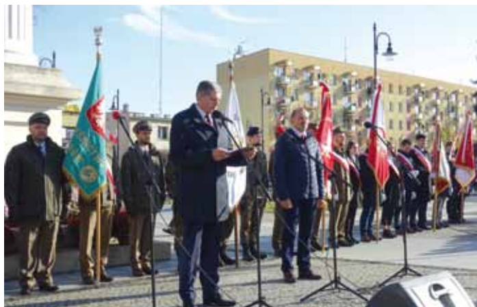
Burmistrz Miasta i Przewodniczący Rady Miasta