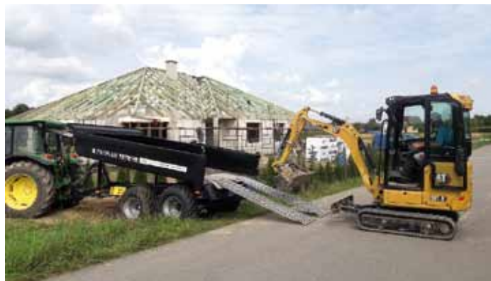
Minikoparka CAT i specjalistyczna przyczepa budowlana marki Pronar