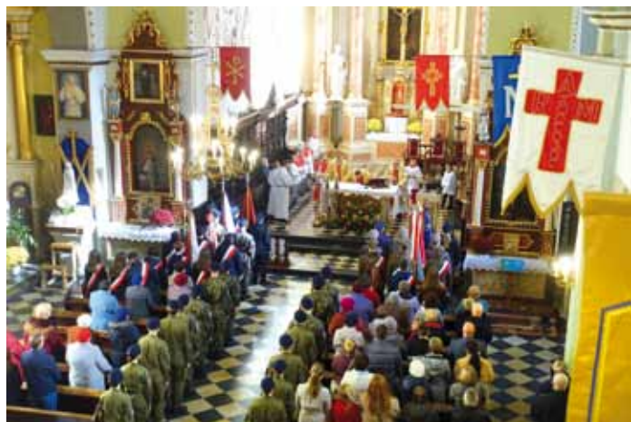
Msza św. w intencji Ojczyzny