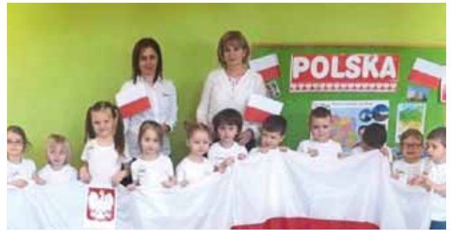
Nowa i ustępująca Dyrektor Przedszkola podczas dnia Święta Flagi

Październik minął wszystkim jeszcze szybciej niż wrzesień szczególnie najmłodszym przedszkolakom którzy codziennie przygotowywali się do ważnego wydarzenia jakim jest Pasowanie na przedszkolaka , bowiem od tego dnia stały się oficjalnie przedszkolakami.